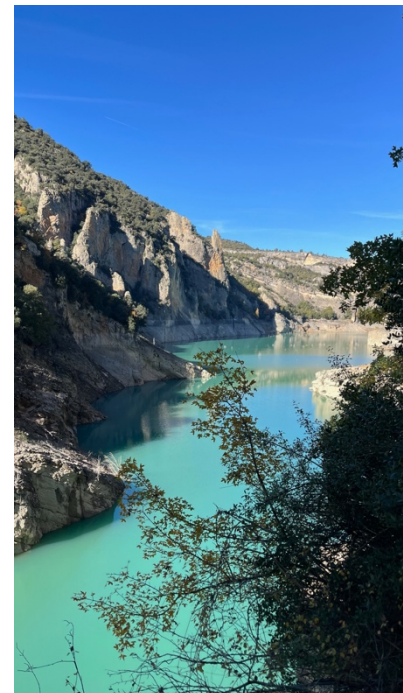
Mont Rebei Canyon

Abgesehen von ESN gibt es auch Erasmus Barcelona, auf Instagram wie auch als App. Sie bieten ebenfalls Ausflüge, kostenlose Clubeintritte sowie verschiedene Ausflüge an, bspw. nach Marokko, Ibiza etc. für einen ganz guten Preis. Dadurch habe ich Tagesausflüge nach Andorra, ein kleines Land zwischen Spanien und Frankreich, und zum Mont Rebei Canyon für jeweils 35 € gemacht. Auch ist es einfach, per Zug Städte in der Nähe von Barcelona wie z.B. Blanes oder Sitges zu besuchen. Und auch in Barcelona gibt es viel zu machen. Gerne bin ich mit Freunden in Bars oder Cafés gegangen, an den Strand, wo Volleyballnetze aufgebaut sind, zu den Bunkers, wo man einen tollen Blick auf Barcelona hat, oder hoch zu Tibidabo. Durch den ÖPNV in Barcelona ist man wirklich sehr flexibel. Ich empfehle die T-Joven Card für 3 Monate, erhältlich für 44€.