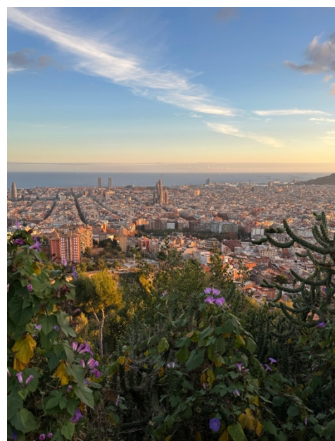
Aussicht von Bunkers del Carmel

Barcelona ist eine großartige Stadt, in der mir das Leben wirklich sehr gefallen hat. Es gibt viele Touristenattraktionen, wie natürlich die Sagrada Familia, die Gaudí Häuser, Parc Güell, Parc de la Ciutadella, Bunkers del Carmel, die Kathedrale von Barcelona oder das gotische Viertel (Barri Gòtic). ESN UPF (Erasmus Student Network @/esn_upf) veranstaltet ab September verschiedene Aktivitäten, durch die man Kontakte zu anderen Auslandsstudenten knüpfen kann. Dazu zählt bspw. Karaoke, Tapas night, Speedfriending,